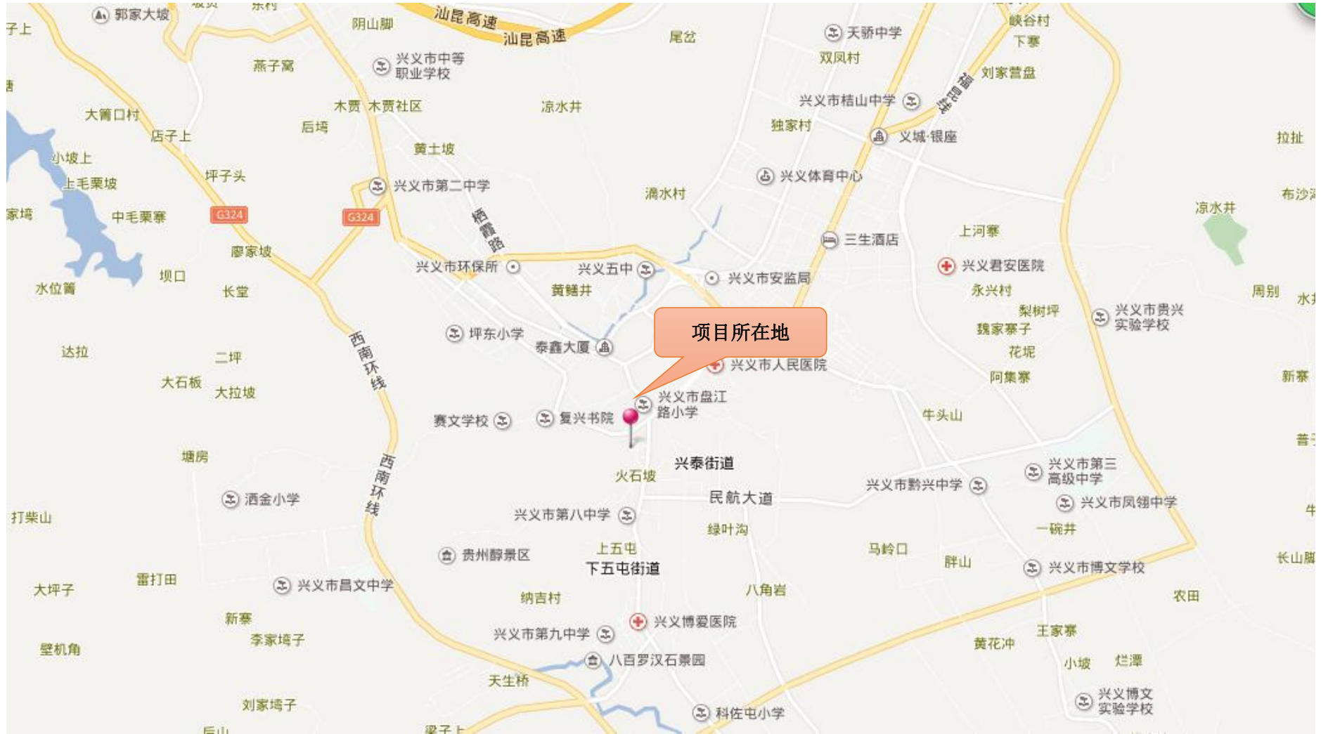
附图 1 项目地理位置图