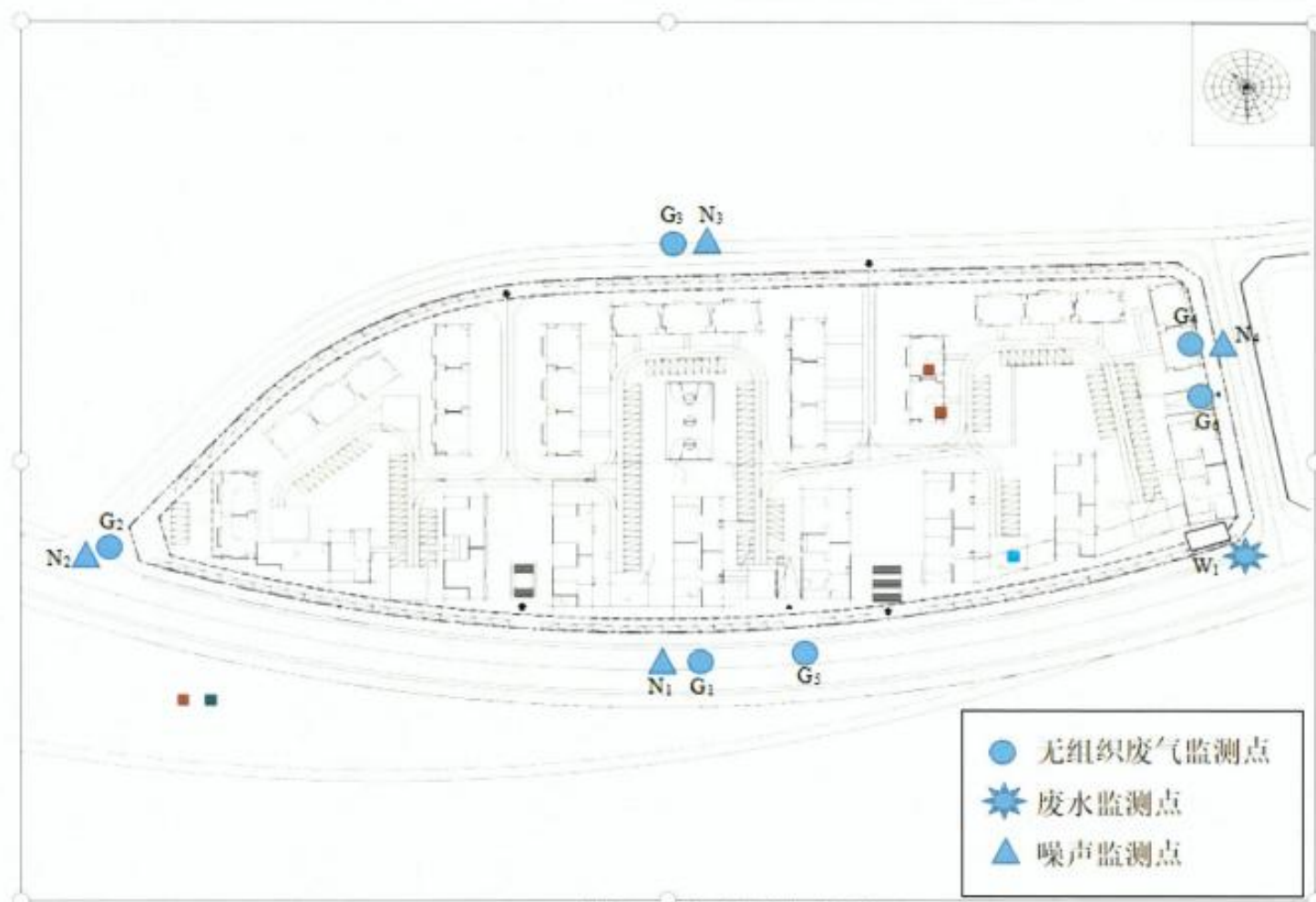
附图 1 现场监测布点图