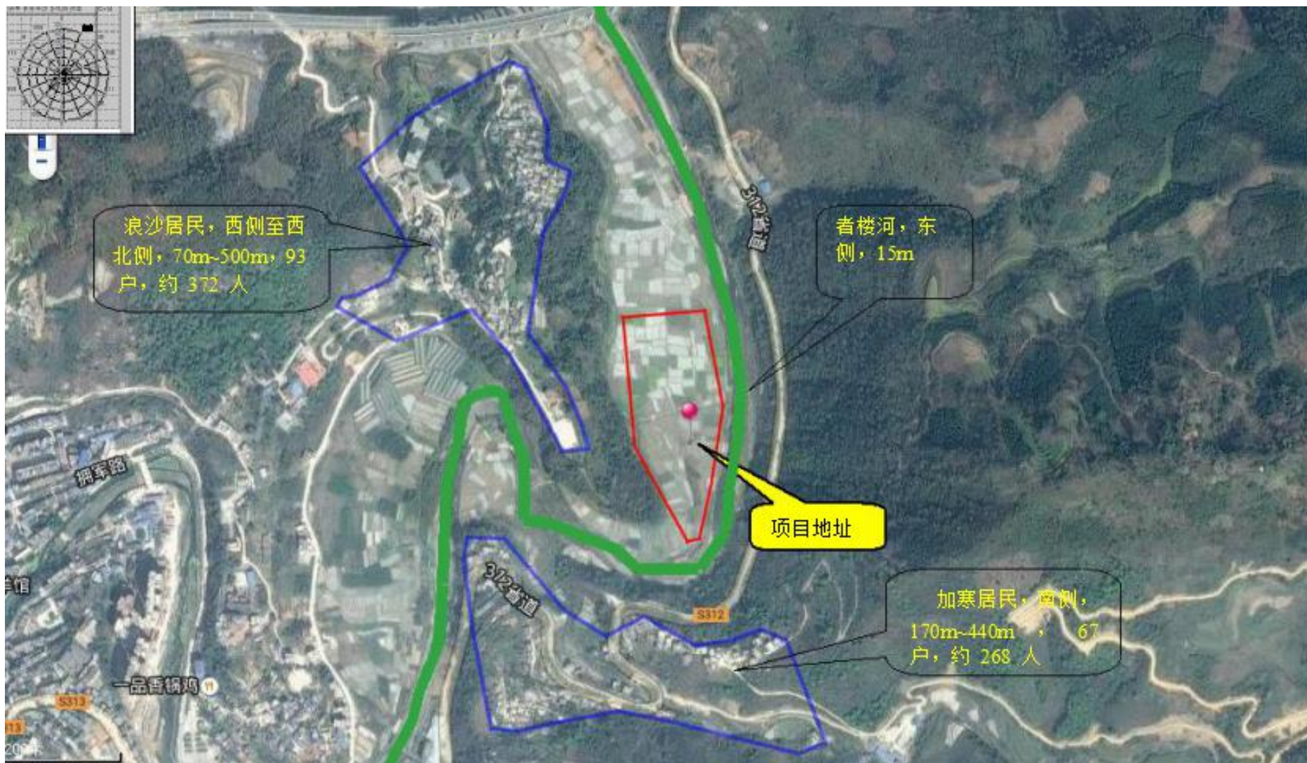
附图2 项目外环境关系图