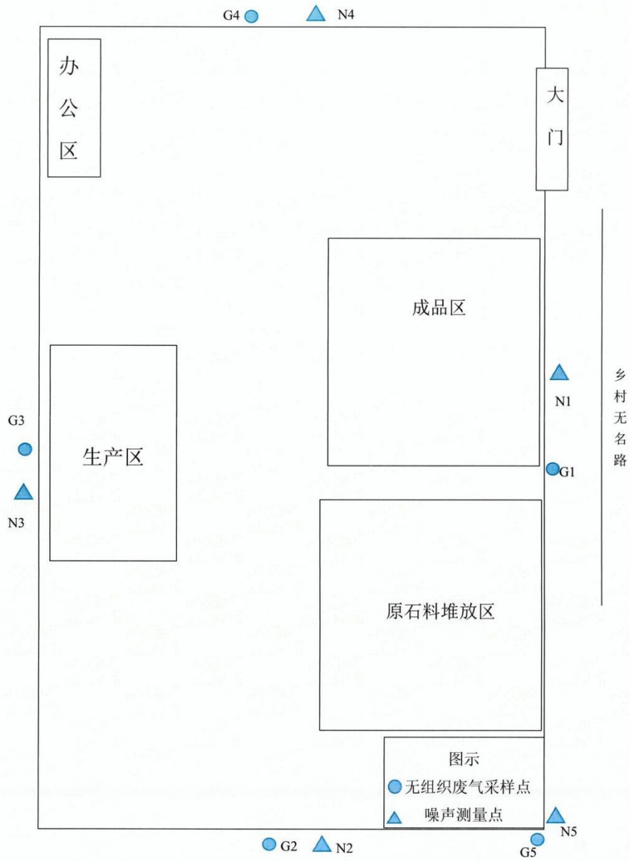
附图 1 监测布点图