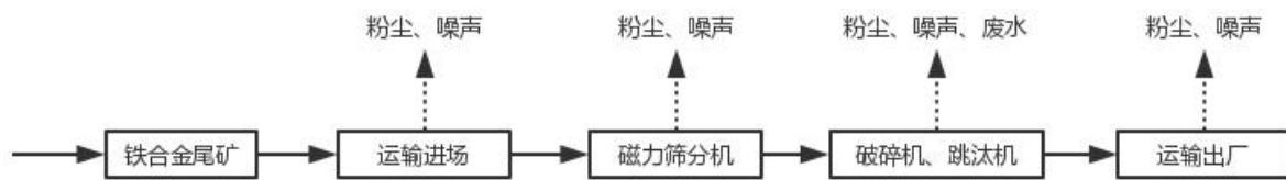
图2-2 项目营运期工艺流程及产污情况

采用磁力筛分机对铁合金尾矿进行筛分，得到含铁粗料和不含铁粗料。不含铁粗料进入堆棚暂存，定期外售给水泥厂做原料。含铁粗料进入下一生产工序，含铁粗料经破碎机破碎后进入跳汰机，全程湿法作业，此工艺主要是利用铁矿与杂质的物理性质不同来进行的，在不同密度或特性的介质中使铁矿与杂质分开，最终得到含铁产品。