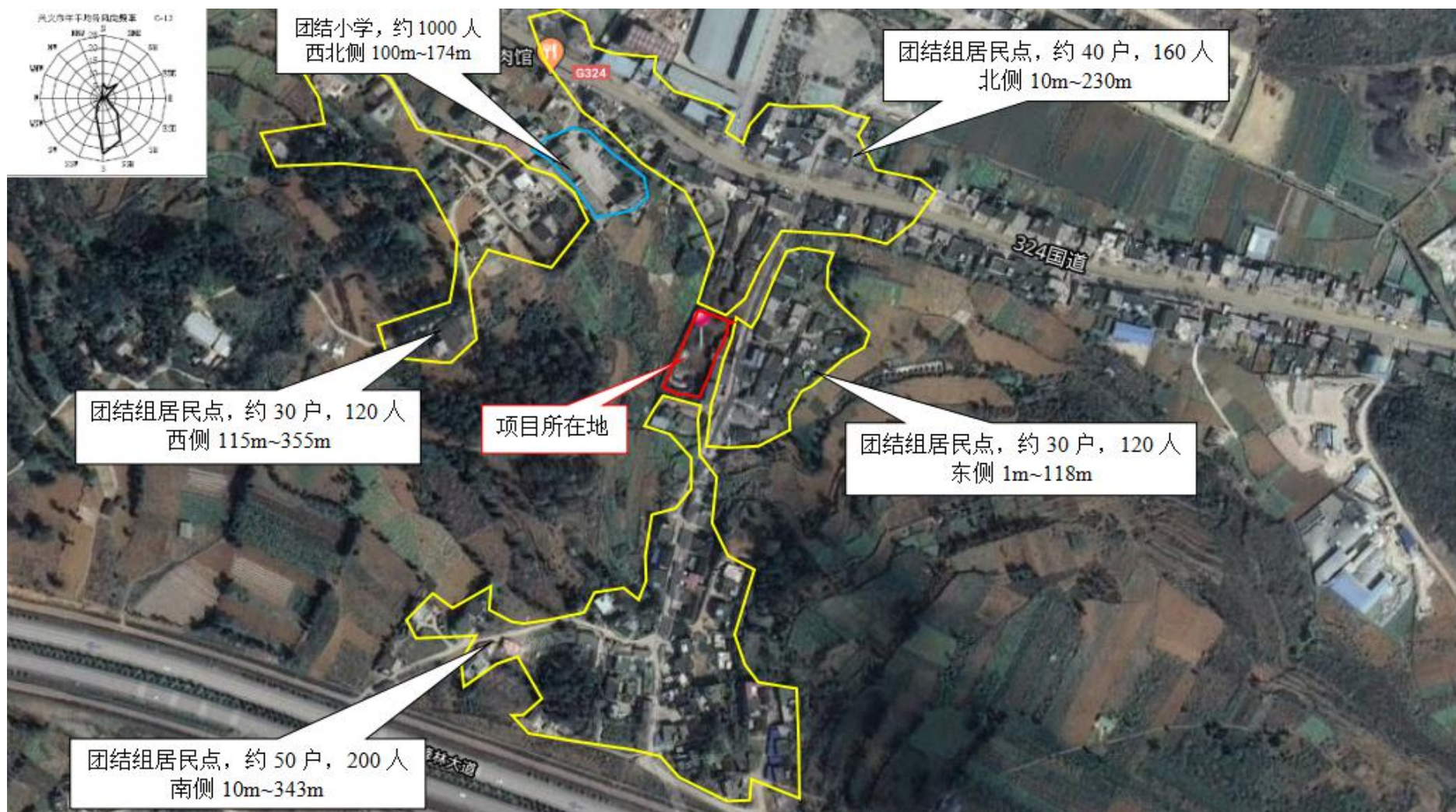
附图2 项目外环境关系