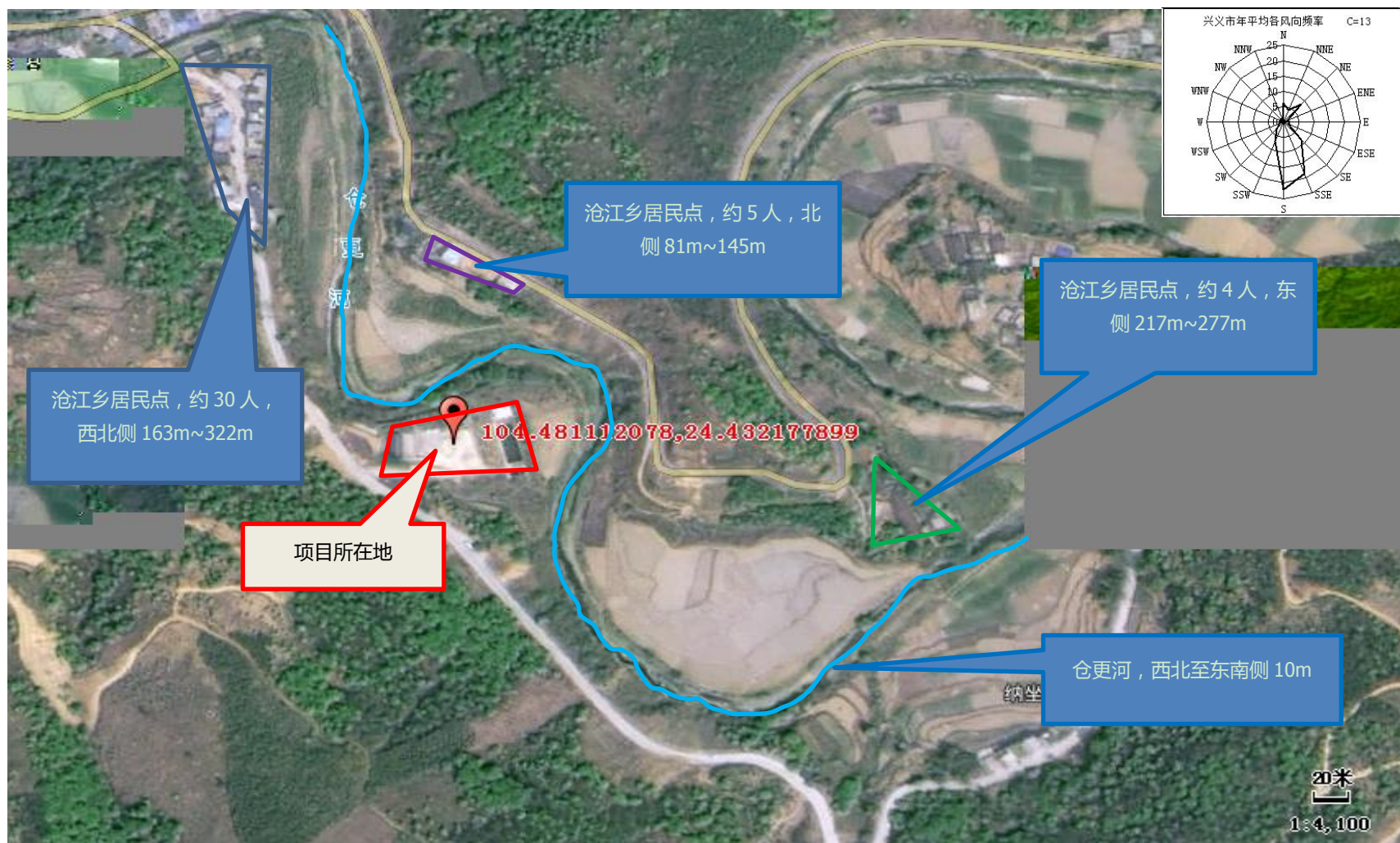
附图 2 项目外环境关系