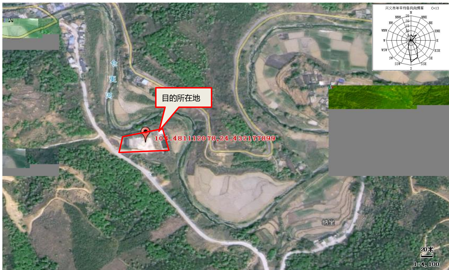
附图 1 项目地理位置图